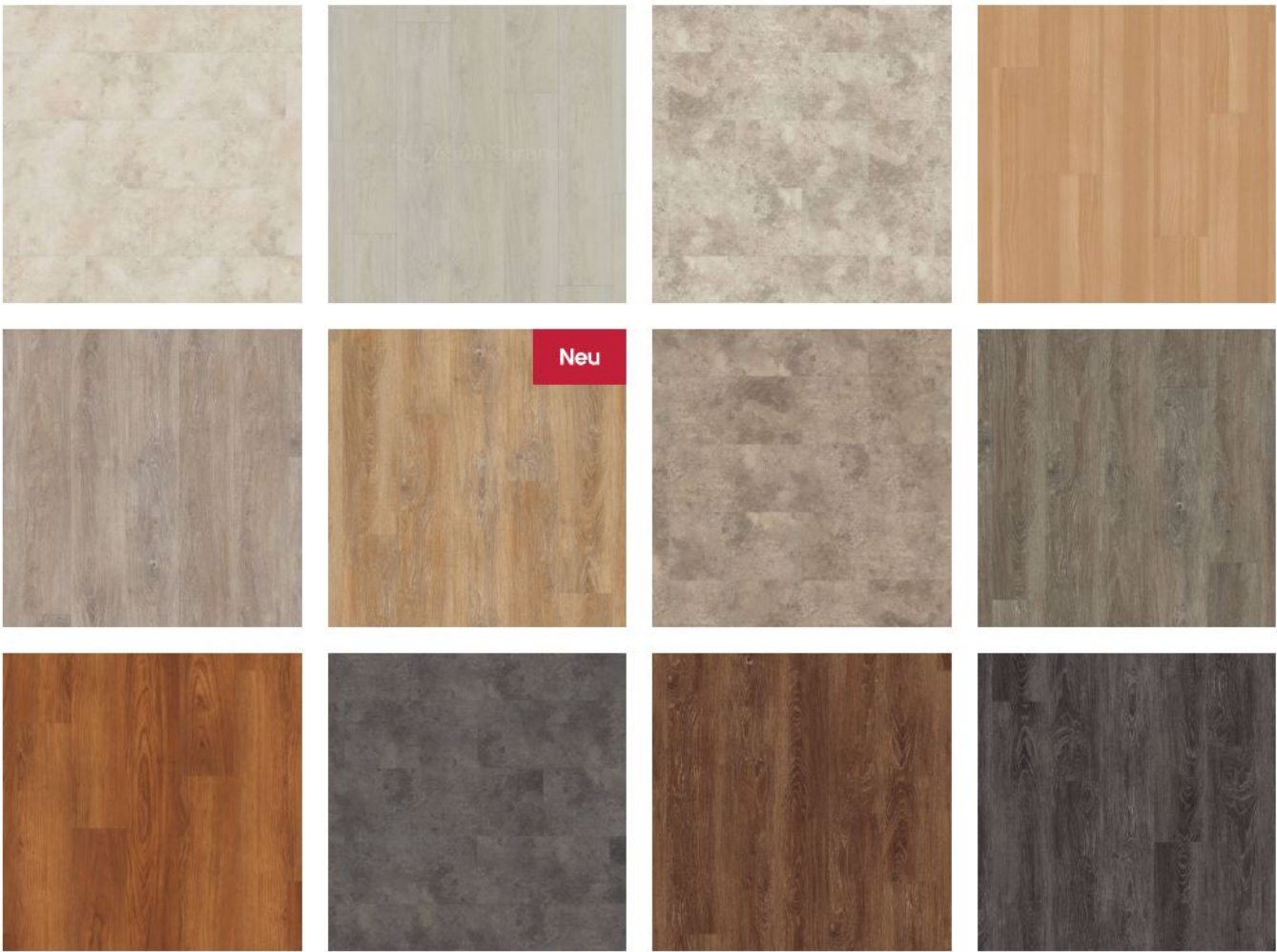
Designflooring Palio Core Designbelag Dekore