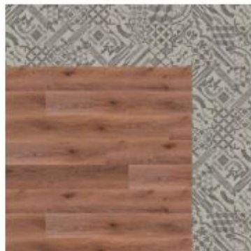
wood / craft