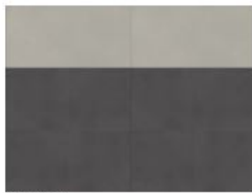
tile L / tile XL