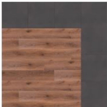
wood / tile