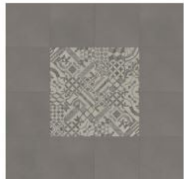
tile L / craft